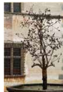
IMMAGINE DI COPERTINA: Il melograno di Issogne, di Agostino Ricci

Gli articoli firmati esprimono esclusivamente le opinioni degli autori