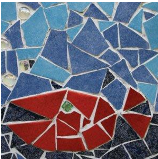
Il pesce mosaico dell’insegnante-artista

“Dalla curiosità di creare e la capacità di entusiasarmi e stupirmi. Spesso basta la suggestione visiva di un oggetto o di una situazione per trascinarsi in un percorso fatto di contaminazioni creative. In un momento particolare della vita ho sentito prepotente il desiderio di esprimere ciò che mi animava.